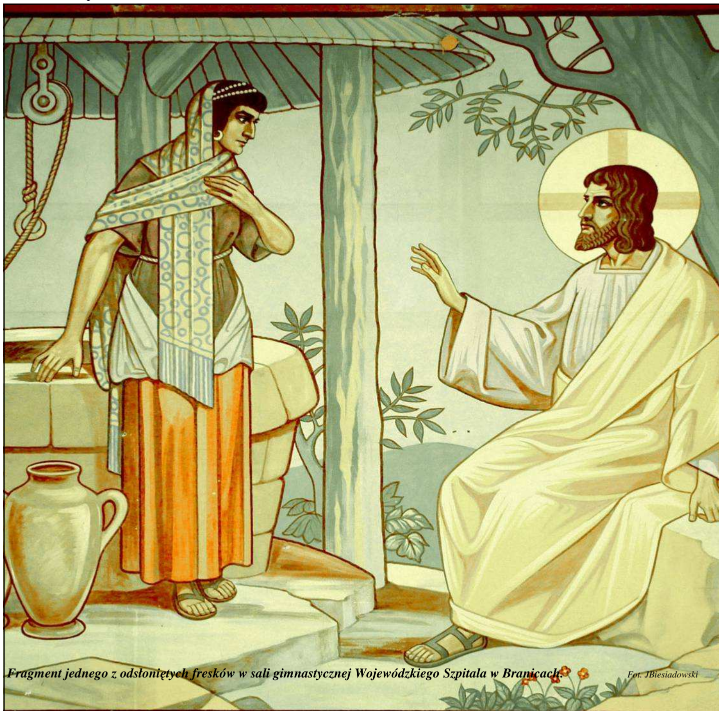
Fragment jednego z odsłoniętych fresków w sali gimnastycznej Wojewódzkiego Szpitala w Branicach.

Czerwiec 2010 wersja internetowa na stronie: WWW.branice.pl