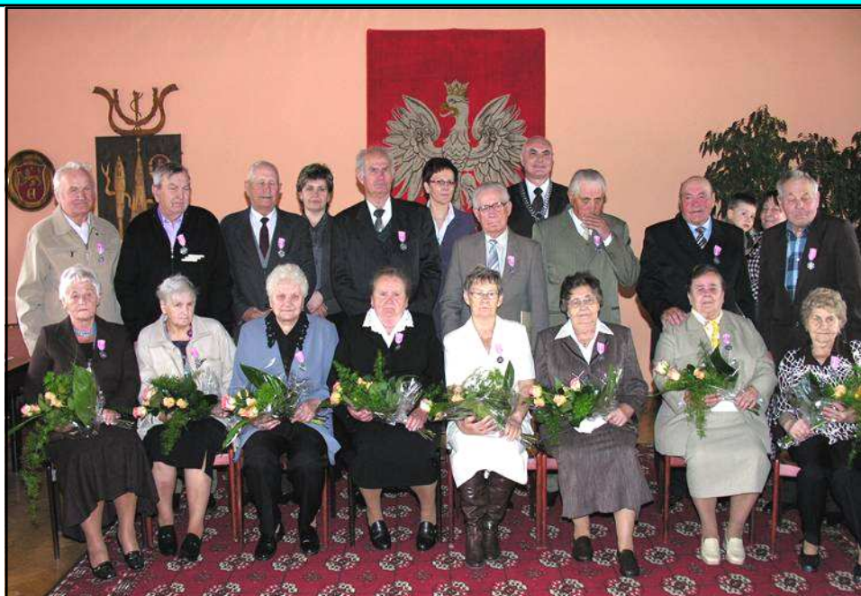
Tekst Jolanta Misiurka

Po części oficjalnej przy ciastku i herbatce jubilaci dzielili się swymi wspomnieniami z przeżytych lat.